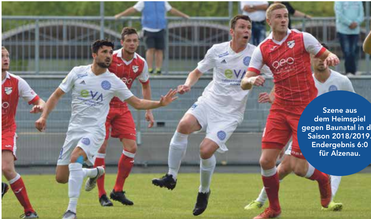
Szene aus dem Heimspiel gegen Baunatal in der Saison 2018/2019. Endergebnis 6:0 für Alzenau.