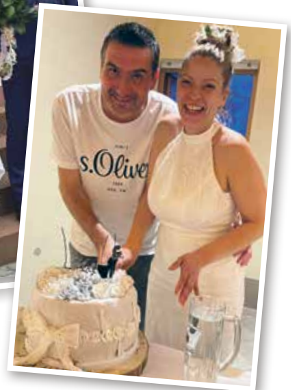
...beim Anschneiden der Hochzeitstorte.